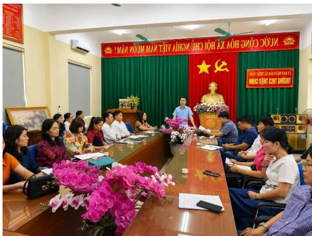
Lãnh đạo UBND xã lấy ý kiến cán bộ quản lý, giáo viên và các đơn vị liên quan.

Quá trình xây dựng các đề án được Đảng ủy xã quan tâm lãnh đạo, chỉ đạo chặt chẽ, bảo đảm đúng quy trình, sát thực tiễn và phù hợp yêu cầu phát triển giáo dục trong giai đoạn mới. UBND xã đã chỉ đạo cơ quan chuyên môn phối hợp với các nhà trường tổ chức khảo sát, đánh giá thực trạng; lấy ý kiến cán bộ quản lý, giáo viên và các đơn vị liên quan; đồng thời nghiên cứu, tiếp thu các định hướng đổi mới giáo dục, chuyển đổi số và phát triển nguồn nhân lực. Các đề án đã được thẩm định, xin ý kiến Thường trực Đảng ủy, Ban Thường vụ Đảng ủy trước khi trình HĐND xã phê chuẩn và triển khai thực hiện.