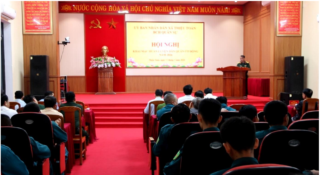
Hội nghị triển khai huấn luyện dân quân tự vệ

Kế hoạch được ban hành trên cơ sở bám sát Luật Dân quân tự vệ năm 2019 và các văn bản hướng dẫn của cấp trên, thể hiện rõ quyết tâm của cấp ủy, chính quyền và lực lượng quân sự xã trong việc củng cố thể trận quốc phòng toàn dân gắn với thể trận an ninh nhân dân ngay từ cơ sở.