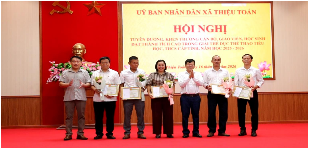
Các Đ/C Lãnh đạo xã trao thưởng cho cán bộ, giáo viên đạt thành tích cao trong giải TDTT