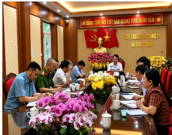
Ban Thường vụ Đảng ủy họp các lần để cho chủ trương.