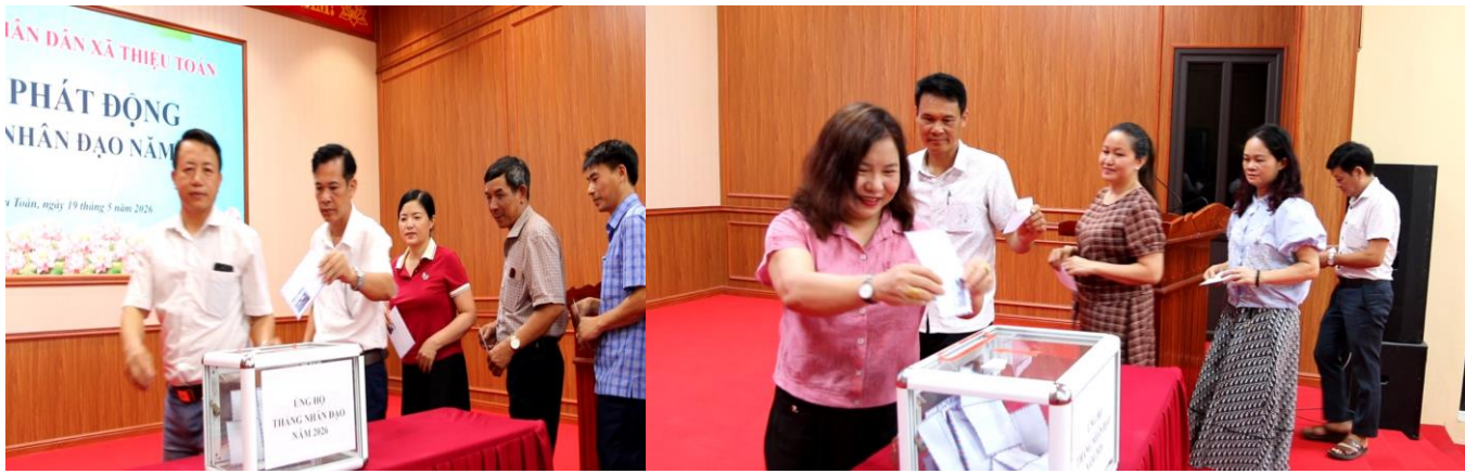
Tại Lễ phát động các đại biểu tích cực tham gia ủng hộ Quỹ cứu trợ nhân đạo

Thông qua lễ phát động Tháng Nhân đạo năm 2026, xã Thiệu Toán tiếp tục khẳng định quyết tâm chăm lo tốt hơn cho các đối tượng yếu thế, góp phần thực hiện hiệu quả chính sách an sinh xã hội tại địa phương. Đồng thời, đây cũng là dịp để giáo dục truyền thống nhân ái, tinh thần sẻ chia trong cán bộ, đoàn viên, hội viên và các tầng lớp nhân dân; xây dựng cộng đồng đoàn kết, nghĩa tình và phát triển bền vững.