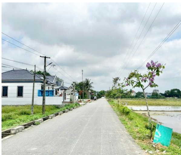
Cây bóng mát đường quê

Với tình yêu quê hương, nhiều con em xa quê đã tích cực đóng góp kinh phí, hỗ trợ công trình, cây xanh và các trang thiết bị phục vụ xây dựng cảnh quan môi trường, nâng cấp hệ thống điện chiếu sáng công cộng. Hội đồng hương thôn Toán Thọ đã ủng hộ lắp đặt hệ thống điện chiếu sáng, bổ sung các đường dây điện, bổ sung số cột điện tại các tuyến đường là 23 cột điện , bổ sung 150 bóng điện đường chiếu sáng , ước tính số tiền ủng hộ tới 600.000.000 đồng . Nhờ đó, nhiều tuyến đường trong thôn đã được lắp đặt hệ thống điện chiếu sáng ban đêm nay đã rực sáng ánh điện. Bên cạnh đấy, huy động đóng góp hơn 35.000.000 đồng mua cây xanh trồng ven đường và chỉnh trang khuôn viên nhà văn hóa.