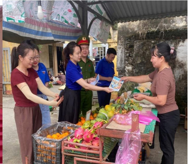
Thanh niên trực tiếp hướng dẫn người dân sử dụng thanh toán điện tử

Mô hình “ Chợ thanh toán không dùng tiền mặt ” việc làm thiết thực của tuổi trẻ Thiệu Toán, gần gũi với đời sống nhân dân, đang từng bước góp phần xây dựng quê hương ngày càng văn minh, hiện đại và phát triển bền vững trong thời kỳ chuyển đổi số.