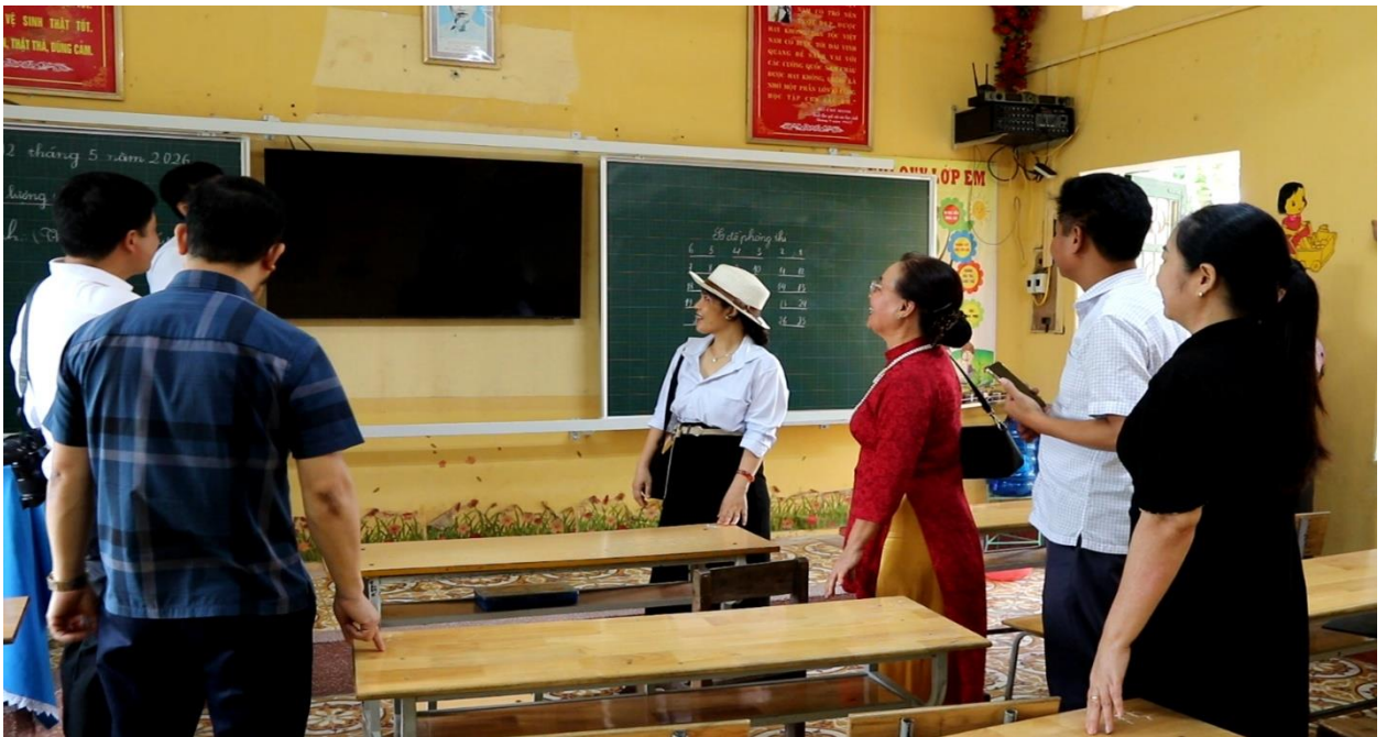
Trao và lắp đặt bảng từ hiện đại

Việc hỗ trợ cơ sở vật chất cho trường học không đơn thuần là trao đi những món quà, mà còn là gieo thêm niềm tin cho thế hệ tương lai. Mỗi chiếc bàn, chiếc ghế, mỗi tấm bảng từ đều mang theo tình cảm chân thành của người trao gửi.