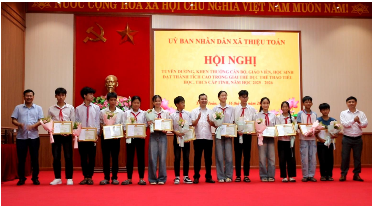
Các Đ/C Lãnh đạo xã trao thưởng cho các cháu học sinh đạt thành tích cao trong giải TDTT

Tại hội nghị, các đồng chí Lãnh đạo xã đã trao giấy khen và phần thưởng 5 cán bộ, giáo viên, có thành tích xuất sắc trong công tác huấn luyện; 12 học sinh đạt giải thi đấu thể dục, thể thao cấp tỉnh năm học 2025 – 2026.