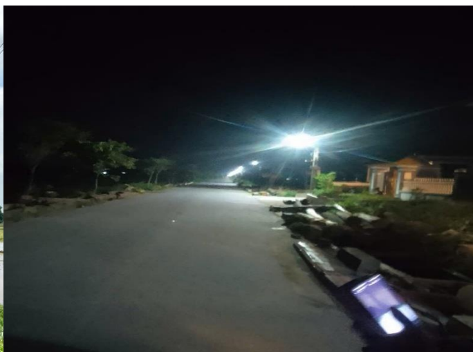
Thắp sáng đường quê