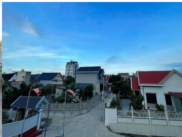
Quê hương Toán Thọ đổi mới