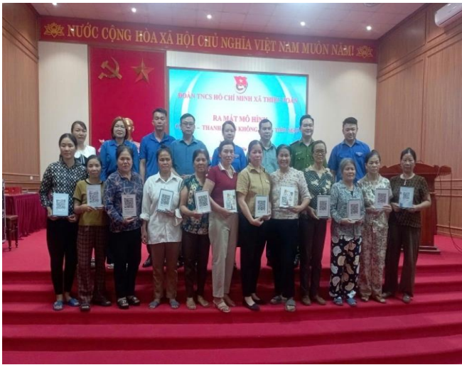
Tặng mã QR Code ngân hàng cho các tiểu thương

động thương mại, mô hình còn thể hiện rõ vai trò xung kích của thanh niên trong việc đồng hành cùng cấp ủy, chính quyền xây dựng xã hội số từ cơ sở. Đây cũng là môi trường để đoàn viên thanh niên phát huy tinh thần sáng tạo, trách nhiệm và nâng cao kỹ năng ứng dụng công nghệ trong thực tiễn.