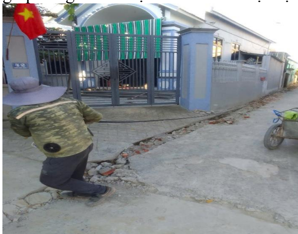
Nhà máy nước đang tiến hành lắp đặt đường ống nước vào thôn Toán Thọ